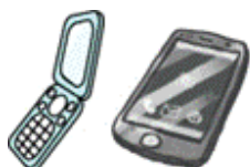
手机·智能手机和·平板电脑