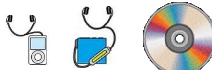
便携式同音乐播放器·光盘·影碟