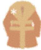
服装·毛草产品 一般认为是死装的范围是可以接受的