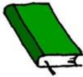
书籍 (包括圣经、经文、相册等)