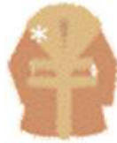
服裝・毛草產品 一般認為是死裝的範圍是可以接受的