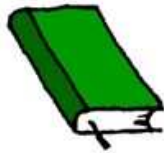
書籍 (包括聖經、經文、相冊等)