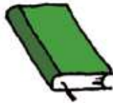
書籍 (聖書、経典、アルバム等も含む)