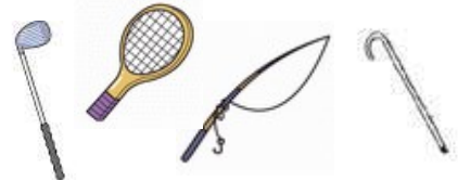
カーボン製の釣り具等 (難燃性)