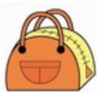
カバン・ハンドバッグ

(3) プラスチック、ゴム製品等 （融解し収骨へ支障をきたすおそれ、及び周辺環境へ影響を及ぼすおそれ）