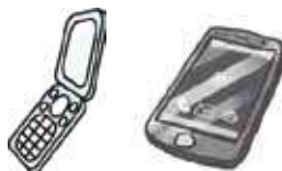
携帯・スマートフォン・タブレット